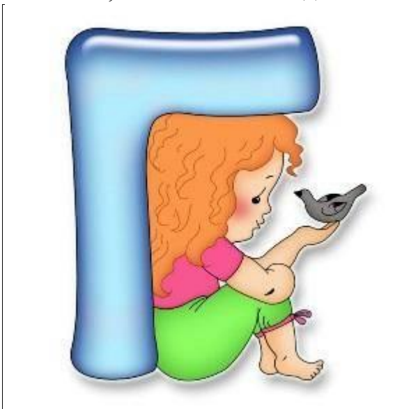
Игра № 27

Например, паук - ударный слог -ук; ёжик - ё-; зайчик - зай-; телефон -фон; осень - о-; малина -ли- и т. д.