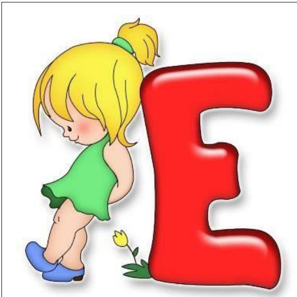
Игра № 26